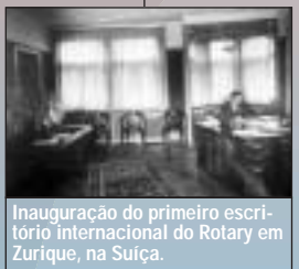
Inauguração do primeiro escritório internacional do Rotary em Zurique, na Suíça.

Rotary Clubs dos Estados Unidos engajam em campanha de arrecadação de fundos de assistência a vítimas de guerra.