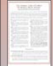
Rotary adota código de ética, prelúdio da Prova Quadrupla

Rotary Clubs contribuem US$25.000 para socorrer vítimas de enchente em Indiana e Ohio, EUA, a primeira iniciativa conjunta de clubes.