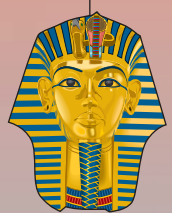
Descoberta do sarcófago do rei Tutancamon

Recebimento da primeira contribuição para a Fundação: US$26,50 do Rotary Club de Kansas City, no Missouri, EUA Epidemia de gripe