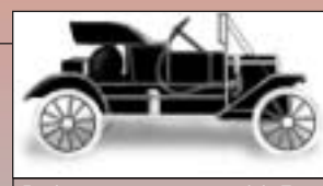
Ford apresenta o carro modelo T

Rotary Clubs contribuem US$25.000 para socorrer vítimas de enchente em Indiana e Ohio, EUA, a primeira iniciativa conjunta de clubes.