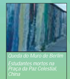
Queda do Muro de Berlim Estudantes mortos na Praça da Paz Celestial, China Fundado o Rotary Club de Moscou, o primeiro clube de prestação de serviços da chamada União Soviética.

Rotary admite a primeira mulher. Em 2005, mulheres assumem como presidentes de clube e líderes distritais, muitas delas alcançando papéis internacionais de liderança. A Bolsa de Valores de Nova York sofre queda dramática na "Segunda-feira Negra" Piloto alemão aterrissa ileso na Praça Vermelha, na Rússia