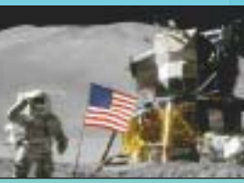
Criação da Arpanet, precursora da Internet Neil Armstrong é o primeiro homem a pisar na lua Yasser Arafat torna-se líder da OLP

Crise dos mísseis cubanos Interact Clubs chegam a 123 no primeiro ano. Lançamento do programa de Serviços à Comunidade Mundial do Rotary