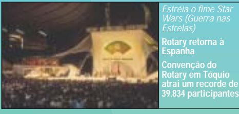
Estreia o filme Star Wars (Guerra nas Estrelas) Rotary retorna à Espanha Convenção do Rotary em Toquio atrai um recorde de 39.834 participantes

Completada a barragem alta da represa de Assuã Rotarianos ajudam vítimas da inundação causada por maremoto em Bangladesh